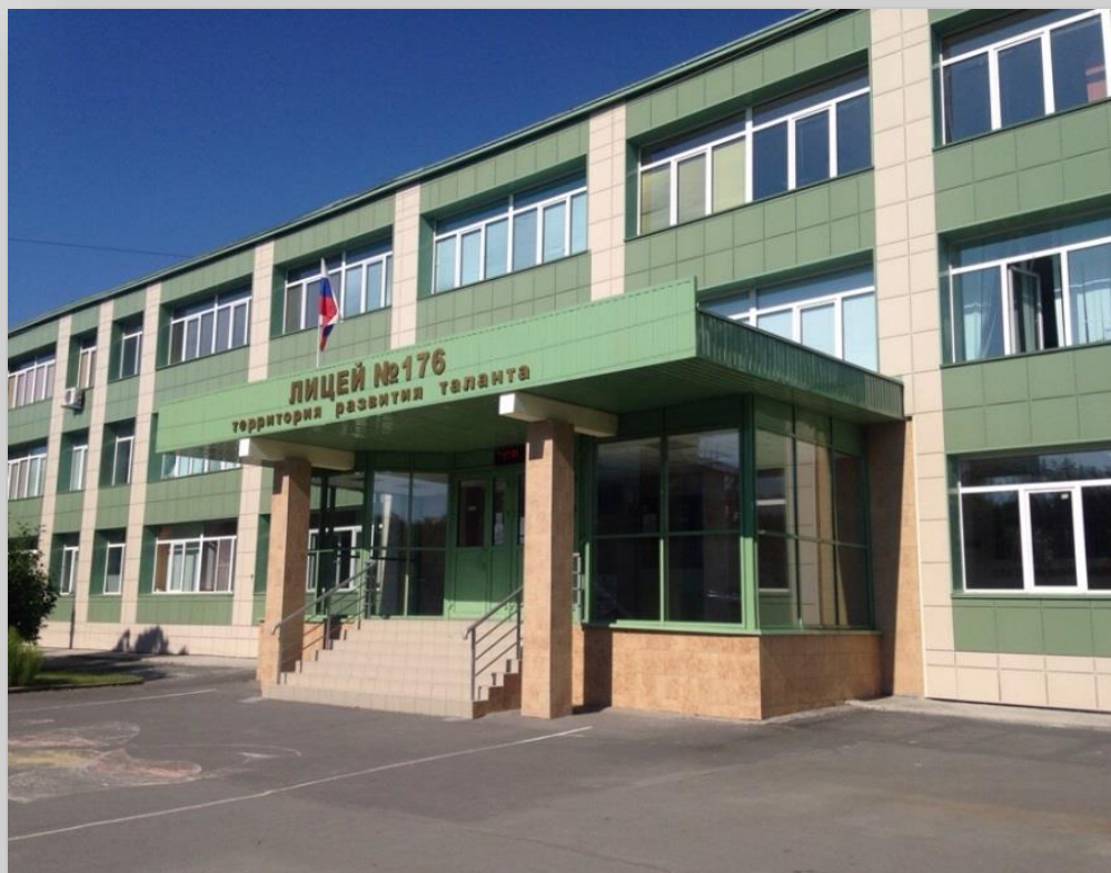
МАОУ «Лицей № 176» города Новосибирска